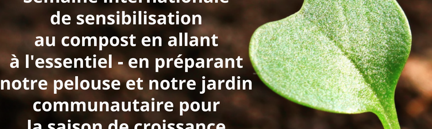
La Garden Party est prête pour une grande saison de croissance à venir.

«Nous parlons aux cuisiniers lorsque nous livrons la récolte à des lieux de partage de nourriture locaux comme St. Francis Table», a déclaré l'un des jardiniers, «et nous cultivons beaucoup de choses qui peuvent être mangées crues ou cuites parce que c'est ce qu'on nous demande. »